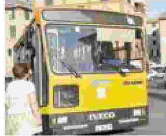
Un bus Atp a Rapallo PIUMETTI

Trasporti sarà di un giorno intero, 24 ore, col servizio di trasporto pubblico assicurato nei soli orari di garanzia previsti dalla legislazione nazionale, e cioè dalle ore 6.00 alle ore 9.00 e dalle ore 17.00 alle ore 20.00. Prima, i rappresentanti dei lavoratori parleranno direttamente alla cittadinanza attraverso un'assemblea pubblica convocata per domani all'auditorium della Filarmonica di Chiavari, in largo Pessagno. Presenti anche diversi esponenti politici: Mario Tullo, deputato Pd; Luca Pastorino, deputato di Possibile; Vito Vattuone, senatore Pd; Gianni Pa-