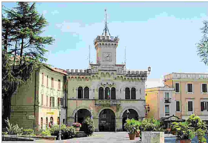
Il palazzo comunale a piazza Trento e Trieste