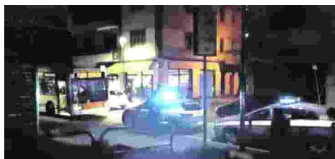
A RISCHIO Sopra un intervento della Polizia. Sotto gli effetti della bottigliata contro un autista, l'altra sera

L'ULTIMO EPISODIO IL LANCIO DI BOTTIGLIE DA PARTE DEI PASSEGGIERI CONTRO UN AUTISTA