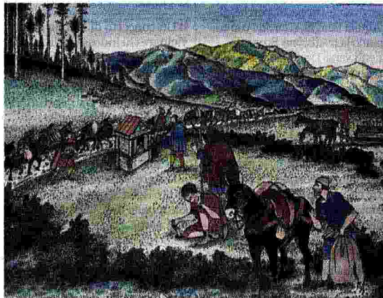
Il valico del Valoria Ricostruzione dell'architetto Riccardo Merlo.

Era il 2011 quando l'archeologo, passeggiando sul Valoria assieme ad un amico, con l'occhio dell'esperto aveva notato un taglio nella coltre erbosa e proprio lì aveva visto una piccola pietra venir fuori dal terreno, un luccichio di un co-