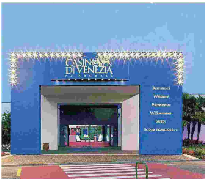
L'ingresso del Casinò di Ca' Noghera

Questo nonostante l'assemblea generale dei dipendenti, indetta l'altra sera (a cui era seguita quella organizzata da Fisascat Cisl, Uilcom Uil, Siam e