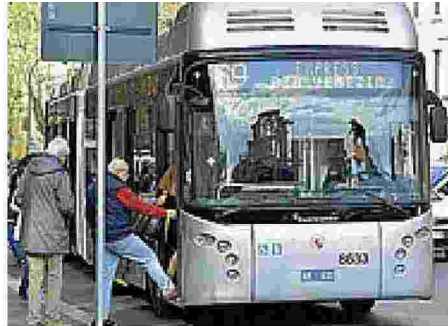
a pagina 5 Problemi Ieri otto dei nuovi filobus hanno avuto guai in strada

La nomina del nuovo dg di Atac, che affiancherà l'amministratore Manuel Fantasia, potrebbe coincidere - sul piano temporale - col disimpegno del capo di Atm Milano, Bruno Rota, che proprio sul mantenimento di un profilo pubblico dell'azienda di trasporti milanese (rifiutando le avances di Ferrovie) è entrato in conflitto col sindaco Sala. La seconda ipotesi darebbe Arrigo Giana, attuale ad Cotral, di ritorno a Milano proprio in Atm.