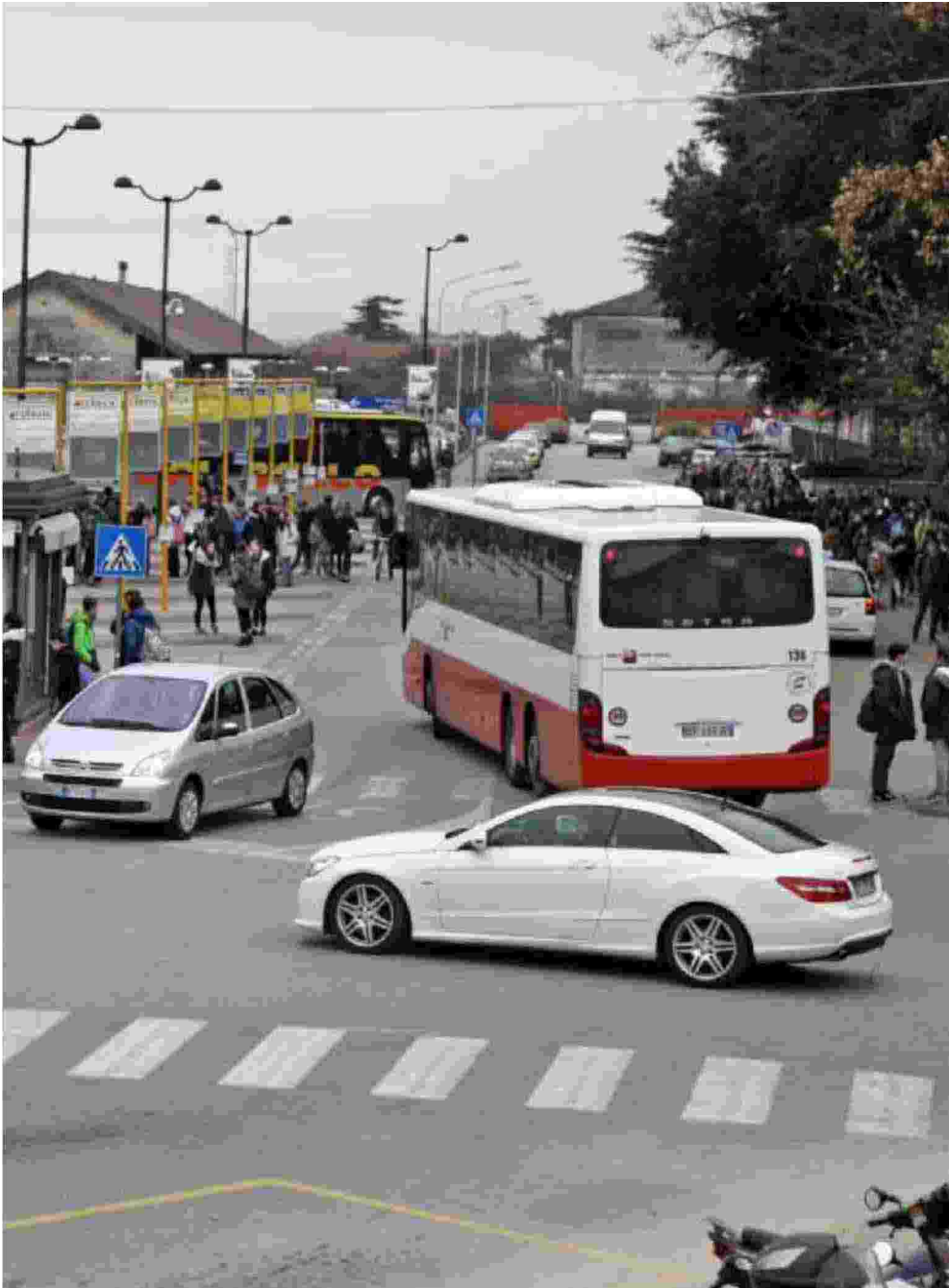
Traffico alla stazione degli autobus di largo Parolini