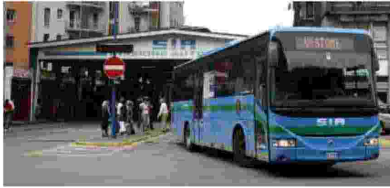
L'autostazione della Sia a Brescia

lo di 24 ore del 12 settembre, di tutti i lavoratori di Sia Autoservizi del gruppo Arriva. Le motivazioni che hanno spinto le organizzazioni sindacali a questa nuova astensione dal lavoro, si legge in una nota, è «la disdetta unilaterale da parte dell'azienda di tutti gli accordi aziendali, con grave attacco alla retribuzione dei lavoratori, e un grave attacco anche all'organiz-