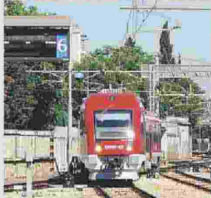
SUD EST Disagi per i pendolari