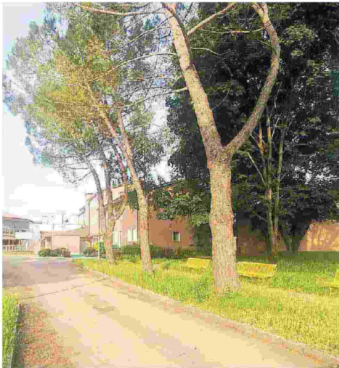
L'edificio che ospita la casa di riposo di Mortegliano

Si attende ora l'incontro fra sindacati e datore di lavoro dal prefetto di Udine, dopo un incontro fra le parti chiuso, come riferito, con nulla di fatto. Nell'occasione, la Euro&Promos ha giudicato che «il carico di lavoro è proporzionato alla tipologia e dalle riunioni con i parenti risulta soddisfacente il servizio erogato». (p.b.)