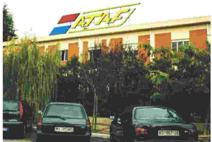
Il pacco è stato trovato davanti all'ingresso della sede dell'Ataf