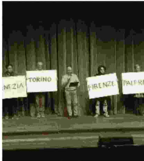
Una delle proteste dei lavoratori del Maggio Musicale