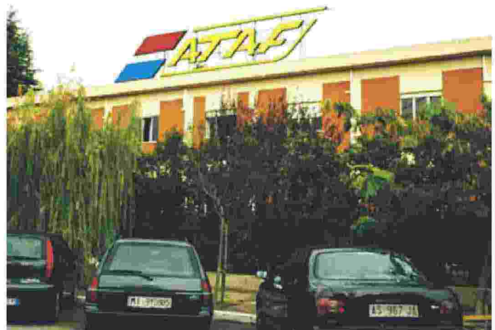
Il pacco è stato trovato davanti all'ingresso della sede dell'Ataf