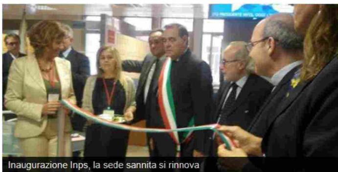
Inaugurazione Inps, la sede sannita si rinnova