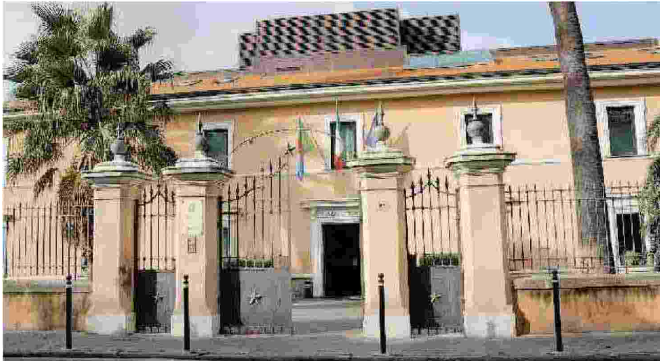
L'entrata del Palazzo di Giustizia di Imperia, in via XXV Aprile

Non avevano sottoscritto il nuovo contratto ed erano entrati in causa