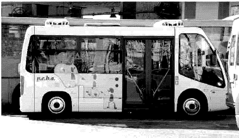
Novità nel trasporto pubblico In alto e a destra i veicoli elettrici acquistati dal Comune di Imperia che saranno utilizzati a Porto Maurizio, in basso i pullman all'idrogeno

Pullman a idrogeno La giunta regionale, su proposta