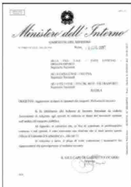
Convocazione ufficiale al Ministero degli Interni

"I sindacati di categoria, soprattutto la Faisa-Cisal e la Fast-Confsal , si sono spesi e continuano a farlo per questa battaglia - hanno continuato -. Giorno 6 settembre è previsto un incontro al ministero degli interni per attenzionare al meglio la vergognosa questione delle aggressioni agli autisti dei bus . Una triste realtà che ha colpito tante città italiane ma che, soprattutto, continua a ripresentarsi imperterrita nella nostra città".