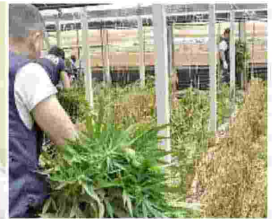
LA NOVITA' Il gruppo dirigente del sindacato autonomo Asacc che tutela coltivatori e lavoratori della filiera della canapa