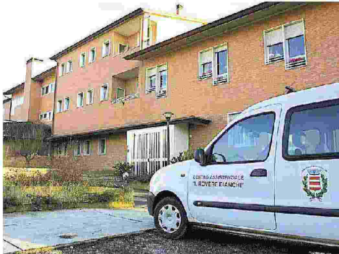
Una veduta della casa di riposo Rovere Bianchi a Mortegliano

All'attenzione del massimo rappresentante del governo sul territorio e alla ex cooperativa (da poco Spa) si illustrano i problemi rilevati, «peraltro - si legge nel documento - già esposti alla direzione della Euro&Promos spa 4 mesi fa. Nonostante l'impegno del sindaco a mettersi a un tavolo per discutere, la dire-