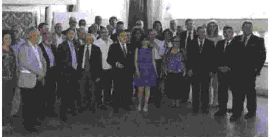
Un'immagine dei delegati presenti alla passata assemblea Inrl