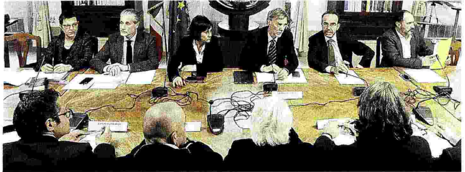
L'INCONTRO Il ministro delle Infrastrutture e Trasporti Graziano Delrio con i sindacati dei tassisti

MA PER ORA L'EMENDAMENTO LANZILLOTTA NON SARÀ RITIRATO DAL MILLEPROROGHE OGGI VOTO DI FIDUCIA