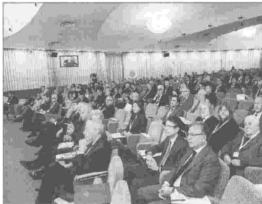
La sala del 2° congresso italo-europeo dell'Inrl presso la Camera di commercio di Brescia