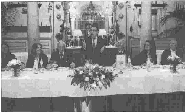
Un momento della cena di inaugurazione del congresso Inrl - 13 ottobre

Pagina a cura di INRL (Istituto Nazionale Revisori Legali) Sede legale: Via Gonzaga, 7 20121 - Milano Sede amministrativa: Piazza della Rotonda, 70 - 00186 Roma Ufficio di Rappresentanza: Rue de l'Industrie, 42 - Bruxelles email: segreteria@revisori.it www.revisori.it