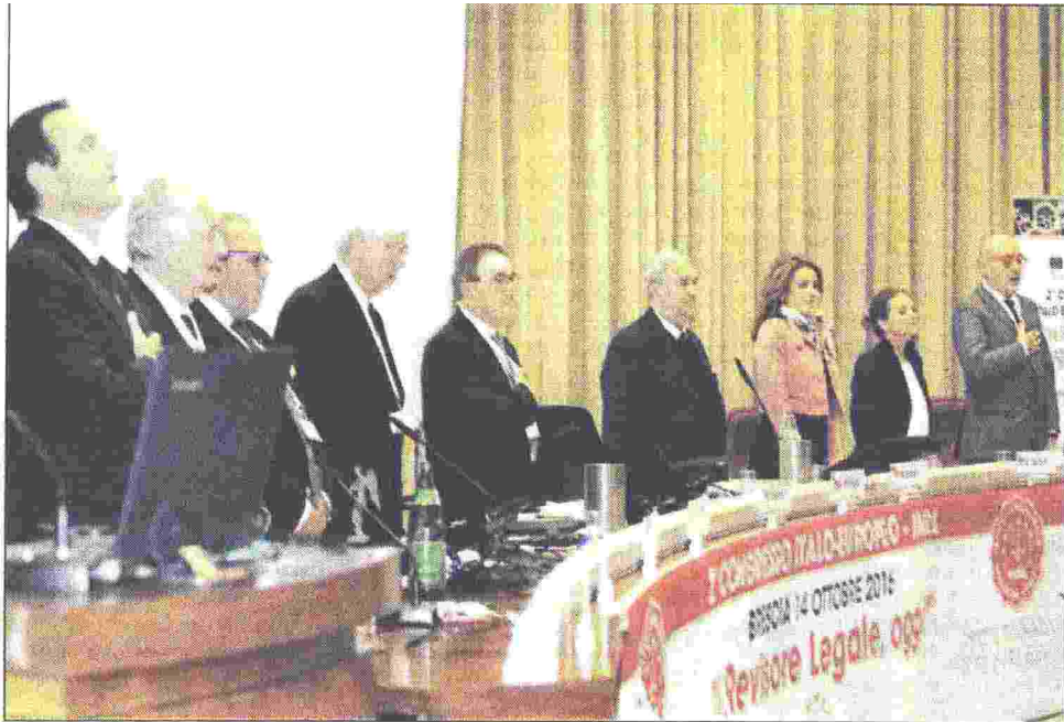
L'apertura dei lavori del 2° Congresso italo-europeo Inrl con l'inno nazionale