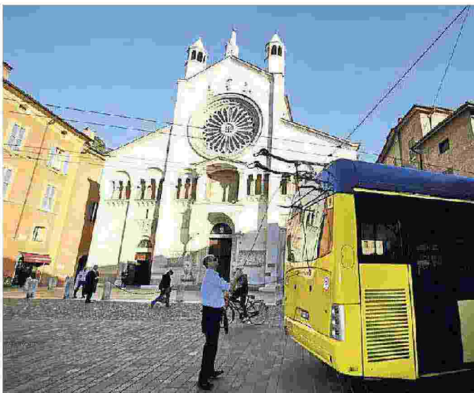
È polemica sulla supermulta in arrivo a Seta per mancate comunicazioni