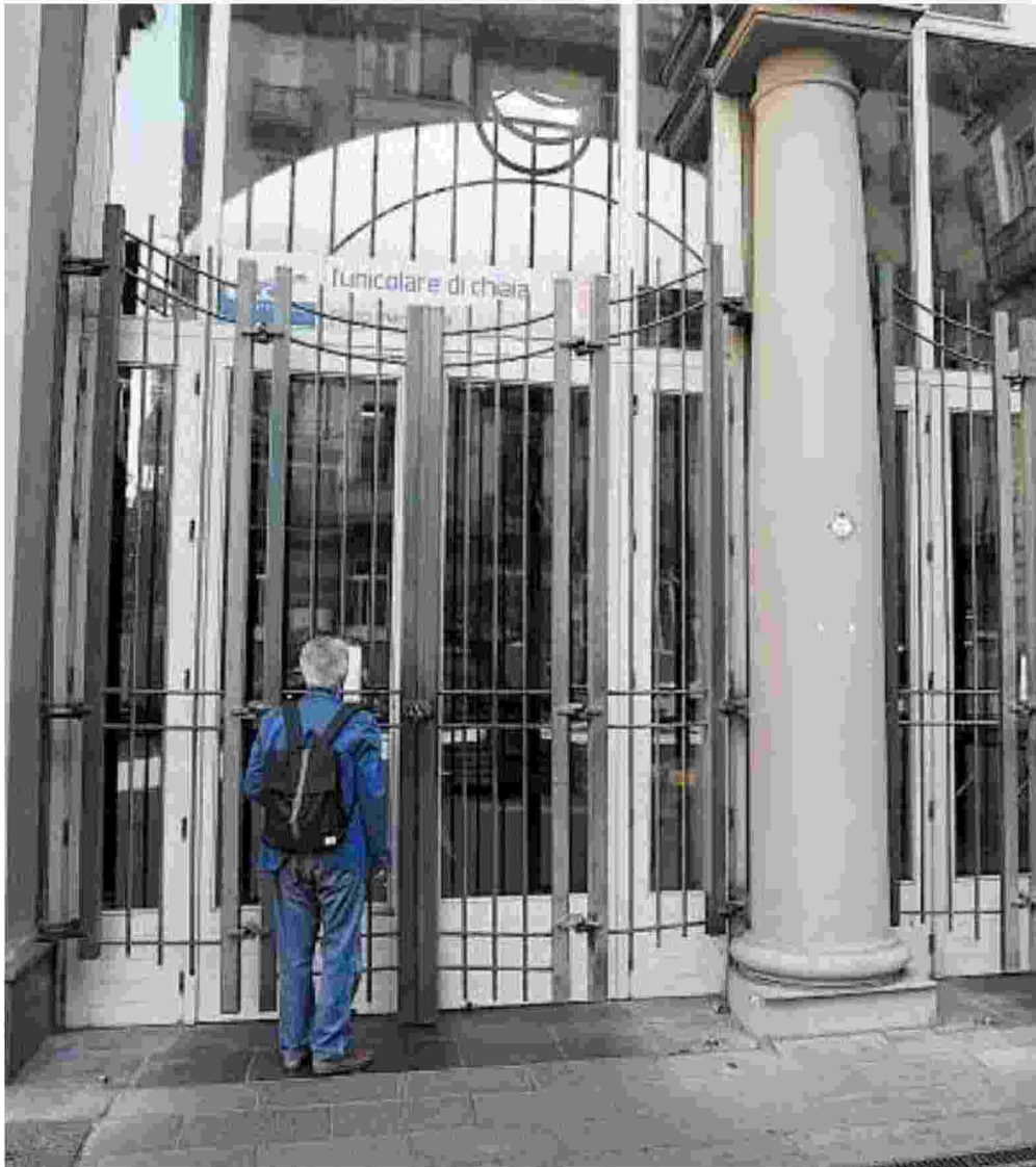
Funicolari bloccate Un problema di una qualifica: scatta lo sciopero; a sinistra la protesta al Garittono