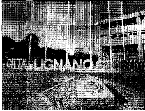
MUNICIPIO La sede del Comune