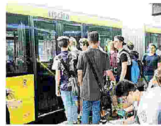
Un mezzo di Seta

«I picchi di malattia per le epidemie stagionali possono capitare ovunque, non solo a Seta Modena - dicono i quattro sindacati uniti - Ma qui a Modena, e non nelle altre città, non ci sono autisti in servizio che consentano di sostituire i colleghi. Una quota di dipendenti in grado di coprire gli autisti che mancano, per ferie o altro, è normale in ogni impresa. Da noi invece i numeri sono ridotti all'osso, quasi un autista per turno». (s.c.)