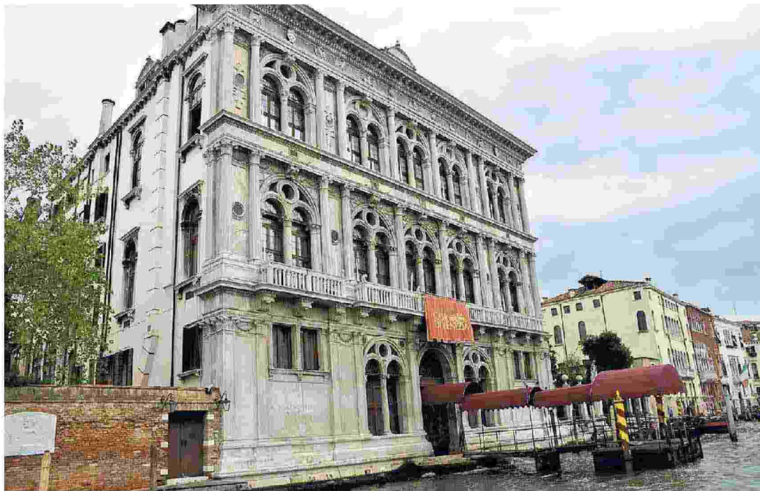
Ca' Vendramin Calergi, sede del Casinò in centro storico

Premi. Il nodo riguarda in particolare la questione dei premi, già definiti nell'ammontare e che nel giro di tre anni dovrebbero avvicinare quelli dei dipendenti più "anziani" ai giovani. Era stato previsto che, nel