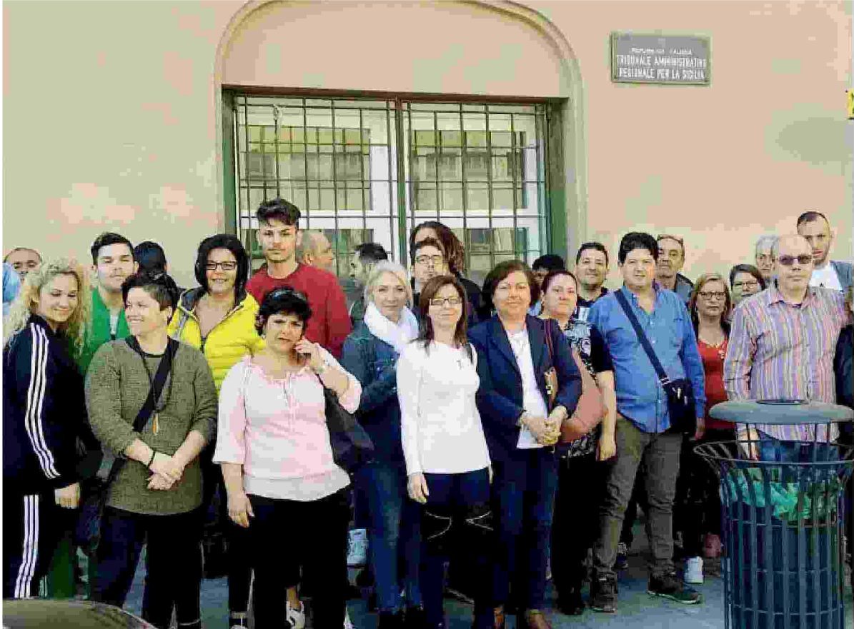
Già un paio di mesi fa le famiglie degli studenti ciechi e ipovedenti avevano protestato davanti alla sede del Tar