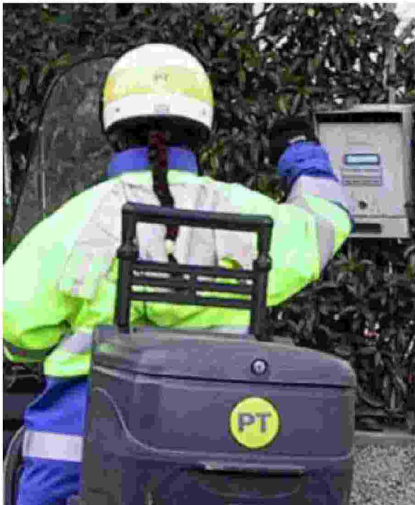
IL PORTALETTIERE "BUSSA" A GIORNI ALTERNI