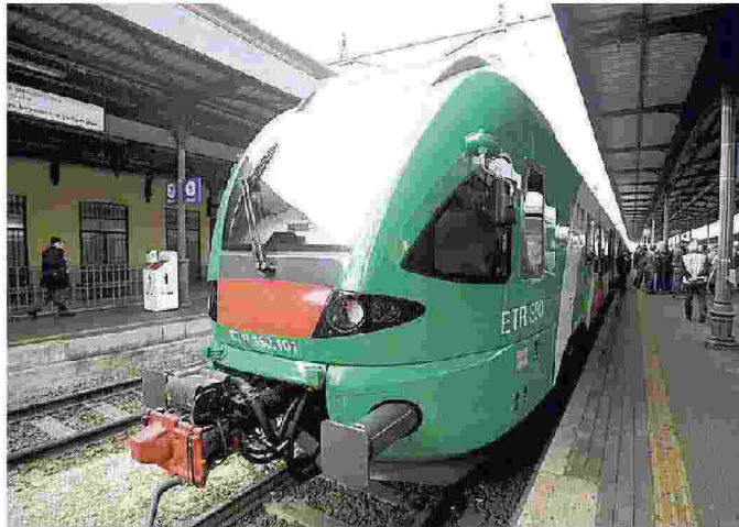
Uno dei 22 nuovi treni regionali inaugurati lo scorso anno da Tper

Già nello scorso mese di febbraio, azienda e sindacati avevano confermato di voler lavorare congiuntamente per lo sviluppo dell'occupazione e per l'investimento formativo sulla professionalità delle risorse umane, con la definizione di un accordo per l'inserimento di conducenti di bus con contratto di apprendistato per la copertura dei fabbisogni per i prossimi anni. A tal riguardo, l'iniziativa ha destato grande interesse anche alla luce del rilevante numero di candidature ricevute (circa 1.000), per le quali le procedure di selezione sono in fase conclusiva. L'accordo firmato, che rappresenta quindi un ulteriore step, offre diversi elementi di rilievo. In primo luogo i ricom-