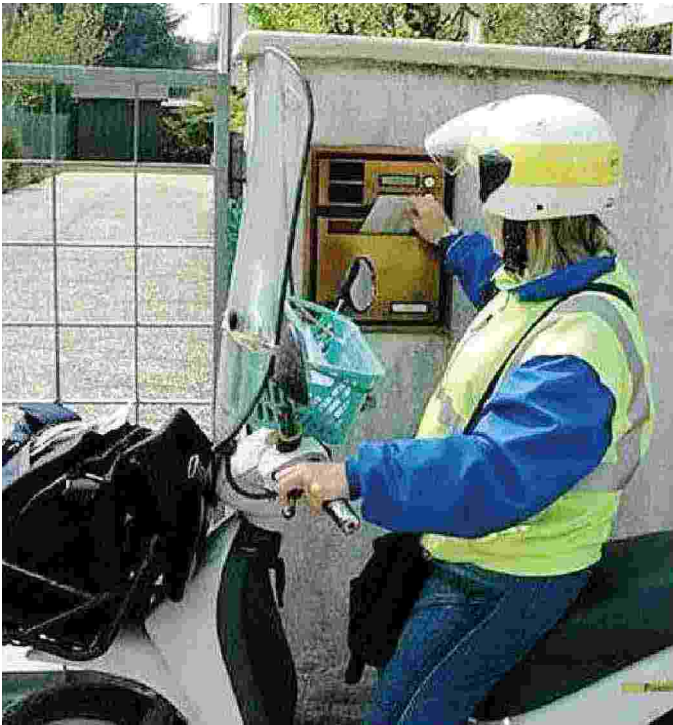
Per i postini si annunciano tempi duri: aumentano le aree di recapito