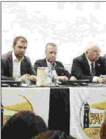
L'incontro del movimento Fare con Tosi