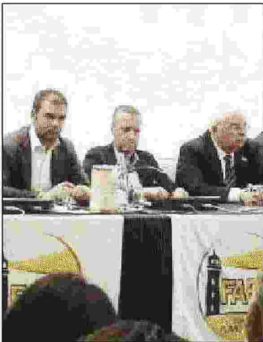
L'incontro del movimento Fare con Tosi