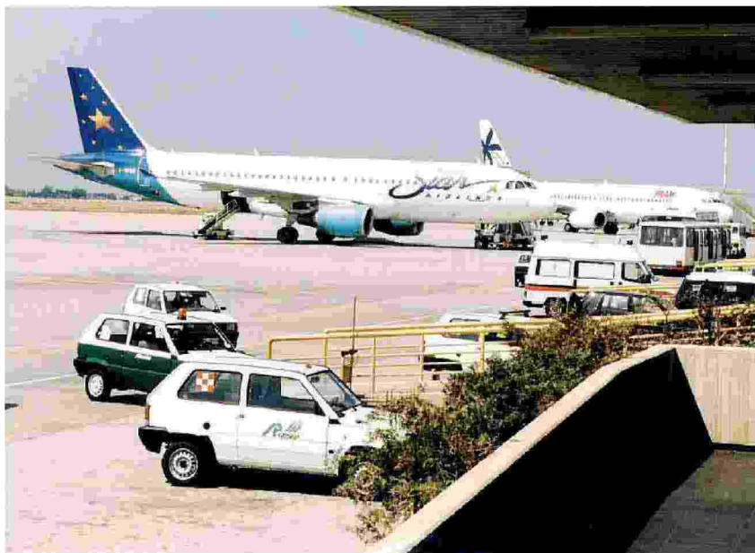
Un'immagine della pista dell'aeroporto «Falcone e Borsellino»