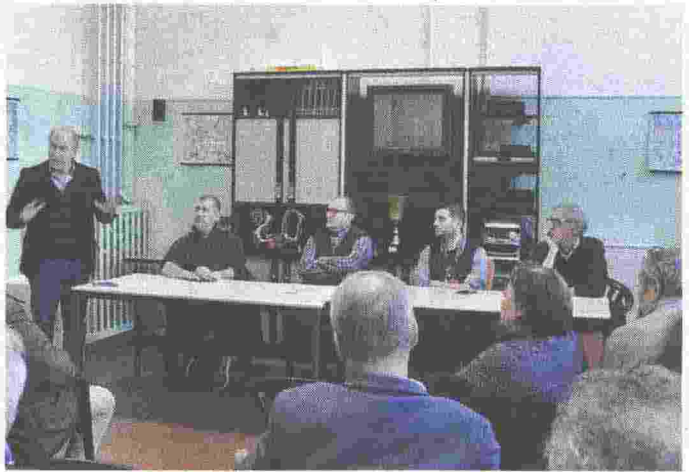
ASSEMBLEA Istituzioni e sindacati al tavolo per affrontare il problema