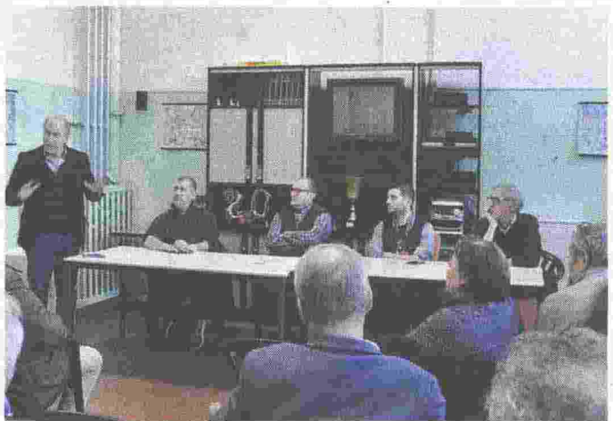
ASSEMBLEA Istituzioni e sindacati al tavolo per affrontare il problema