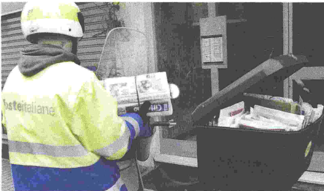
LA PROTESTA Resta carico di tensione il rapporto fra Poste Italiane e i sindacati del comparto: scatta lo sciopero

Commissione europea. Il piano di Poste va rivisto"». Il Lodigiano, secondo quanto appreso da fonti sindacali, dovrebbe essere coinvolto dalla consegna della corrispondenza a giorni alterni a partire dal 2017. «A questo vanno aggiunte le voci di una possibile ulteriore cessione di quote azionarie di Poste Italiane che porterebbe sotto il 50 per cento la soglia di partecipazione dello Stato. Questo renderebbe evidente l'abbandono della socialità e dell'universalità dei servizi postali mettendo a rischio l'unicità dell'azienda. Facile prevedere che il passo successivo sarà quello di spaccettamenti e scorpori di rami d'azienda, con pesanti ricadute sui servizi e sulla tenuta occupazionale». Ecco perché i sindacati hanno deciso di interrompere le relazioni industriali e scioperare.