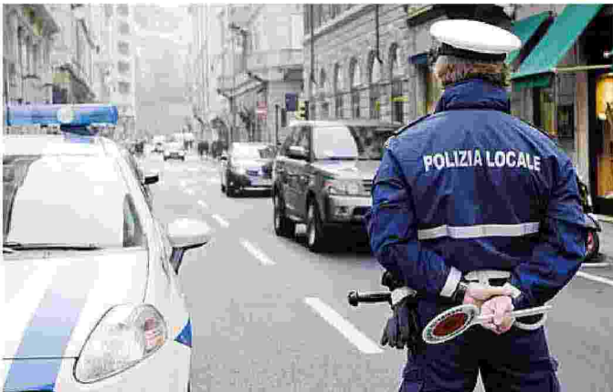
Una pattuglia della Polizia locale impegnata in controlli

Varie le problematiche portate ieri all'attenzione dell'assemblea: per il corpo triestino, dal momento che Sgonico non ha personale, significherebbe occuparsi anche di un'altra zona. Un'altra parte della provincia da monitorare, un'area in cui peraltro vige il bilinguismo. L'altro nodo riguarda la pianta organica, che di fatto verrebbe ridotta: lo statuto dell'Uti indica che il nuovo assetto (sono attualmente in 240, sotto di una cinquantina di posti) si trasforma in quello che risulta nell'atto di "transito" tra un ente e l'altro. Ciò precluderebbe nuove assunzioni, oltre ad allargare il raggio di azione del corpo di Polizia locale in un territorio più ampio. (g.s.)