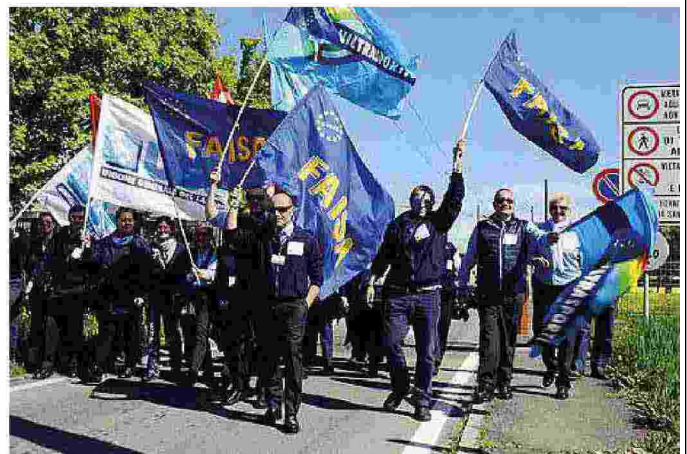
Un momento della manifestazione del personale in sciopero ieri mattina