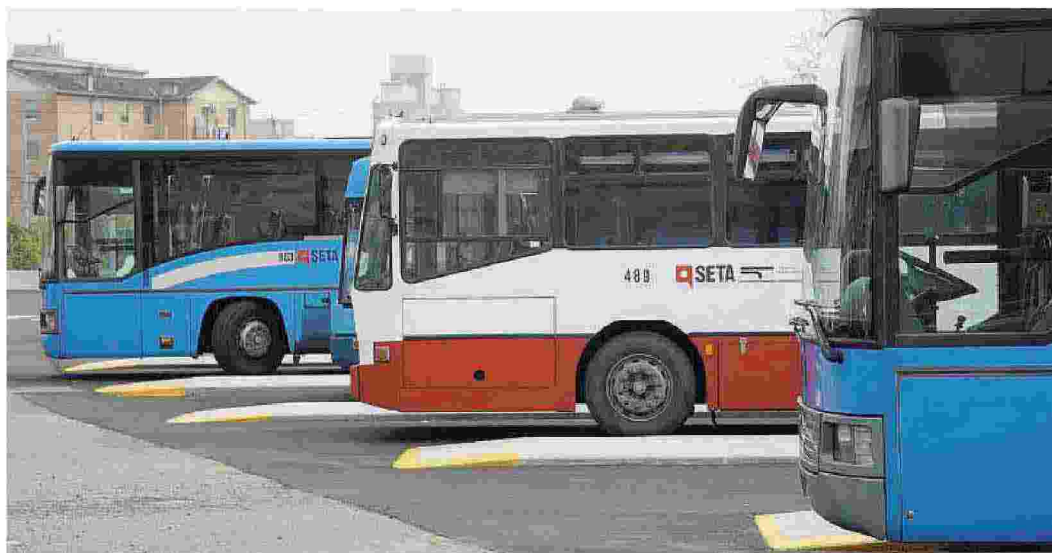
Tutte le altre sigle sindacali saranno in campo per il nuovo sciopero programmato sabato 16 dicembre

ma di un verbale di Incontro, di essere in linea tra di loro fino dal 22 novembre 2017, giornata dell'intersindacale che ha visto due posizioni diverse sul come proseguire sulla vertenza. Nel tavolo di ieri qualcuno ha visto e capito grandi aperture da parte di Seta, noi non abbiamo visto aperture che potessero essere di soluzione alla vertenza ma solo un teatrino con attori che avevano concordato un copione utile solo a prendere in giro i lavoratori di Seta e a fare capire chiaramente a tutti i presenti che le relazioni sindacali sono solo tra Seta e Cgil. Non ci rimane che esprimere la nostra profonda delusione nel vedere che Cgil ha deciso di stare a quel tavolo nonostante che tutte le altre organizzazioni sindacali avevano abbandonato la riunione». Conclude la nota delle quattro sigle: «La diplomazia è finita, ognuno si prenda le proprie responsabilità. _mapo.