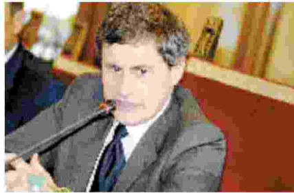
Alemanno Sindaco dal 2008 al 2013 la delibera per la regolamentazione degli Ncc era attesa da anni

■ Cominciano ad arrivare le prime «rivincite» giudiziarie per l'ex sindaco Gianni Alemanno che ieri è stato proscioltto dall'accusa di abuso d'ufficio in relazione alla delibera con cui, nell'ottobre del 2012, la giunta capitolina aveva stabilito che gli Ncc provenienti da altri comuni dovessero pagare per l'ingresso nella Ztl. La decisione è stata presa dal Gup Paola Della Monica, che ha proscioltto Alemanno perché «il fatto non costituisce reato». A denunciare l'ex sindaco era stata una associazione di Ncc. Il provvedimento contestato prevedeva che i titolari di licenza rilasciata da altre amministrazioni dovessero comunicare l'ingresso nelle zone a traffico limitato della capitale e quindi pagare per l'ac-