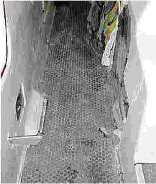
I danni all'interno dell'autosnodato

Un gruppo di autisti occupa gli uffici dell'azienda. Paura su un autosnodato