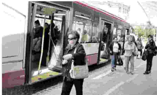
In arrivo la gara europea per il trasporto pubblico locale

Gambacorta: bilancio in rosso per contenziosi, manutenzione e mancanza di liquidità