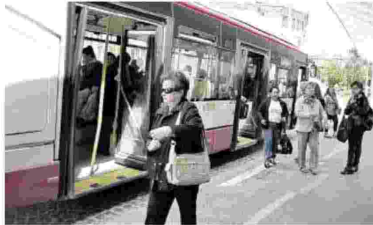
In arrivo la gara europea per il trasporto pubblico locale

Gambacorta: bilancio in rosso per contenziosi, manutenzione e mancanza di liquidità