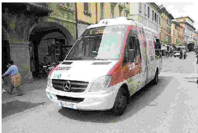
Violenza e vandalismo, sabato scorso, contro un Minibù e l'autista