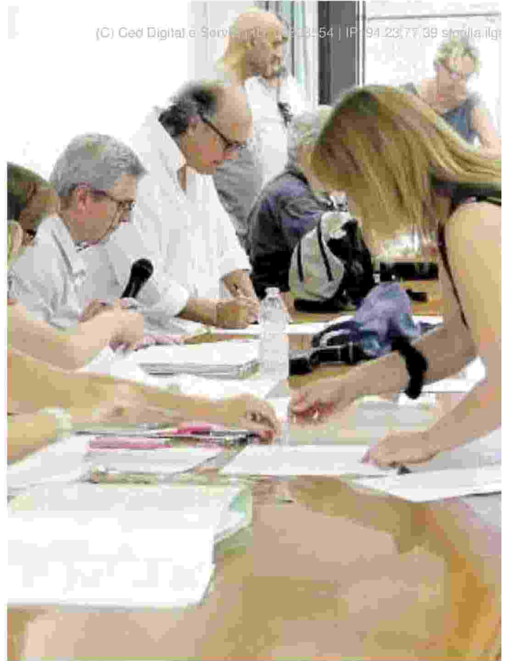
SCUOLA Ancora prima di inizia tira già aria di sciopero