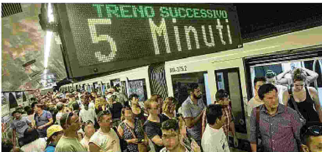
Assalto Pochi convogli e spesso stracarichi: viaggiare in metro, soprattutto nelle ore di punta, è sempre una scommessa