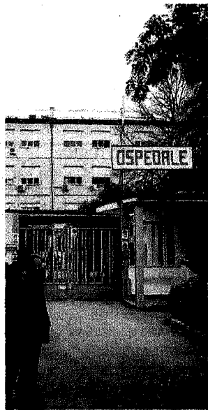
Diritto alle cure. L'ospedale Jazzolino presidio da sostenere

Giudicato, infine, positivamente «il coinvolgimento dell'opinione pubblica vibonese» e l'impegno in prima linea «della Chiesa. Un fatto inedito per cui bisogna dare atto ai primari dell'Asp che questa circostanza è una grande scommessa - conclude Cavallaro - per capire se questa iniziativa è la più ideale per scuotere la sensibilità e l'animo di chi fino a questo momento ha disatteso, puntualmente, gli impegni assunti anche in tempi non vicini». ◀