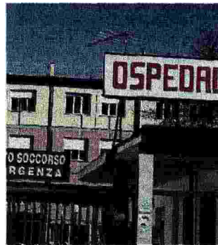
Il progetto. Il nosocomio cittadino al centro del dibattito