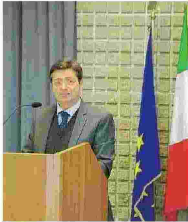
Carmine Bartolomeo della Cisa