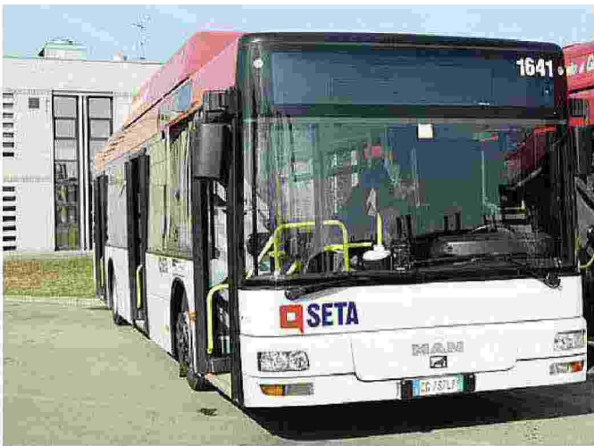
Il 18 gennaio un ordine di servizio Seta ha introdotto i controlli degli autobus

I rappresentanti sindacali, in definitiva, hanno però sottoscritto una nota nella quale ritengono «esperita con esito negativo la prima fase della procedura di sciopero».