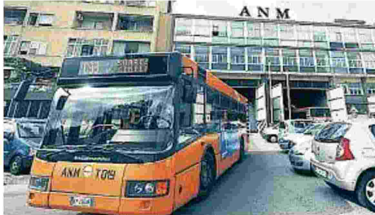
L'AZIENDA Corsa contro il tempo per l'approvazione del bilancio

Ma già si preannunciano disagi: venerdì è previsto lo sciopero di 4 ore (9-13) di metro, bus e funicolari, proclamato dalla Faisa Cisal sulla vertenza dei capiservizio delle funicolari. Confronti