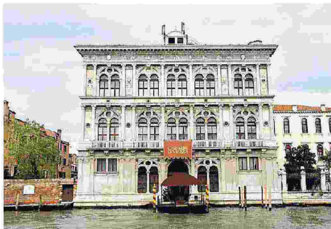
Ca' Vendramin Calergi, sede del Casinò di Venezia

Proprio ieri Slc Cgil, Fiscat Cisl, Snaic Cisl, Rlc, Ugl Terziario e Sgb hanno comunicato infatti all'azienda, tramite le segreterie veneziane, la proclamazione dell'astensione dalle prestazioni straordinarie e aggiuntive di tutti i lavoratori di ogni settore e reparto della Casinò di Venezia Gioco Spa, dalle ore 6 del 2 ottobre alla stessa ora del primo novembre. I motivi sempre quelli che hanno già originato le proteste e gli scioperi precedenti: rinnovo del contratto aziendale di lavoro, salvaguardia occupazionale e rilancio dell'azienda. Il blocco degli straordinari in un'azienda come il Casinò, dove il gioco si concentra nelle ore serali e notturne, ha evidenti riflessi anche sulla funzionalità della casa da gioco. (e.t.)