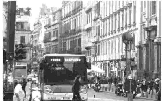
● I pullman dell'Anm in sciopero