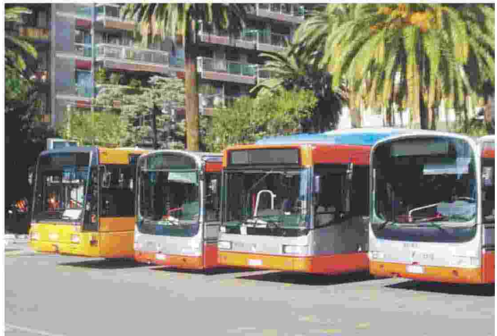
CAPOLINEA Autobus dell'Amtab in piazza Moro, dove un verificatore ha picchiato il suo capo