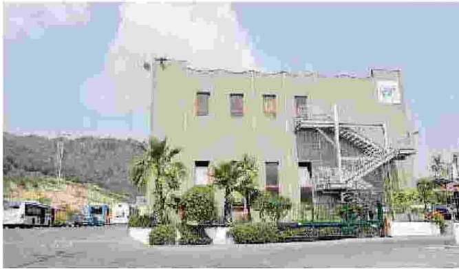
La sede della Riviera Trasporti in via Nazionale

A lla riunione che si terrà oggi erano stati invitati anche i sindacati «ribelli», quelli che non avevano firmato gli accordi e che hanno poi fatto causa all'azienda, vincendola. La Faisa-Cisal però ha già fatto sapere che diserterà. Volevano partecipare sì, ma alla presenza del loro legale, l'avvocato Giuseppe Acquarone. E così oggi alla riunione allargata indetta dalla Riviera trasporti ci saranno solo i componenti del Cda e i rappresentanti dei principali azionisti. L'invito esteso ai sindacati era una sorta di tentativo di transazione in extremis. L'azienda è stata infatti condannata dal giudice del lavoro a pagare alla cinquantina di lavoratori estromessi dagli accordi e privati di una fetta di salario