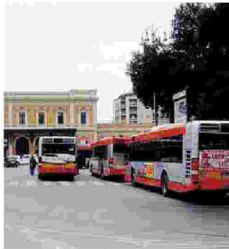
SERVIZIO IN IV» STAZIONE Il capolinea

● Finisce nei guai un verificatore di bordo dell'Amtab che due mattine fa al capolinea della centralissima piazza Moro avrebbe perso le staffe con un suo superiore sino a mandarlo al pronto soccorso. All'origine dell'acceso diverbio ci sarebbero dissapori sui turni, sui percorsi e sulle linee che ogni mattina vengono assegnati ai dipendenti incaricati di salire sui bus e di fare piazza pulita dei «portoghesi».