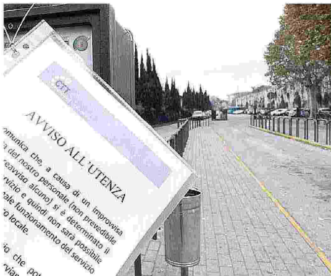
IL 15 settembre sarà un giorno difficile per muoversi con i bus

Le segreterie provinciali di Filt-Cgil e Uilt-Uil hanno proclamato uno sciopero di quattro ore in tutte le province in cui è attiva la Ctt Nord. A Pisa e provincia i mezzi si fermeranno dalle 12 alle 15.59 e il rientro a casa delle migliaia di studenti che il 15 settembre torneranno sui banchi di scuola subirà notevoli disagi. La proclamazione dello sciopero arriva al termine di un lungo braccio di ferro tra la società di trasporti e i sindacati, con quest'ultimi che hanno chiesto all'azienda di sospendere immediatamente le forme di concessione in subappalto di una trentina di turni lavorativi per sopperire alla mancanza di personale e di mezzi che consentano alla Ctt Nord di svolgere il servizio. Durante il tentativo di conciliazione in sede prefettizia dello scorso 25 agosto (concluso con un verbale di disaccordo) convocato a