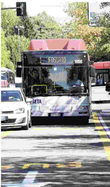
Un autobus di Seta in circonvallazione a Reggio Emilia

«Spiace costatare – sostiene – che l'unico punto di non unitarietà sostenuto dagli altri sindacati sia la presenza della Cgil al tavolo. Tutte le altre argomentazioni sono le stesse affrontate in maniera unitaria in precedenza, le stesse di cui si sta discutendo. Questo non è fare sindacato». Da ultimo la Filt-Cgil rivendica «l'aver portato a casa il premio di risultato 2017» e conclude: «Continueremo ad analizzare nel merito i punti dell'armonizzazione contrattuale a partire dagli orari di lavoro e successivamente sul trattamento dei nuovi assunti».